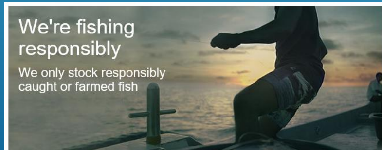
Waitrose responsible fish sourcing policy