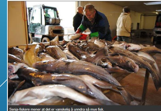
Senja-fiskere mener at det er vanskelig å unndra så mye fisk.

Senja-fiskere kjenner seg ikke igjen i påstandene om juks og bedrag ved fiskemottakene.