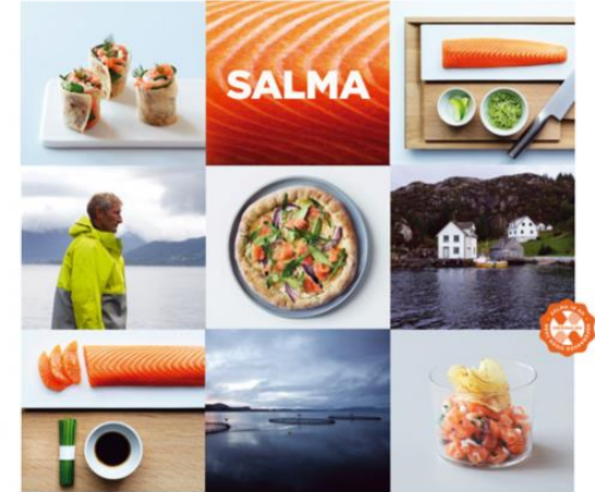
SALMA – fresh salmon products