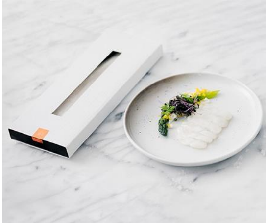
Snow White Halibut fra Glitne