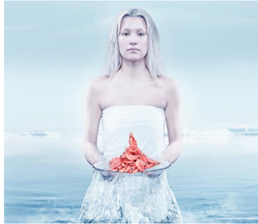
Cold Water Prawns of Norway