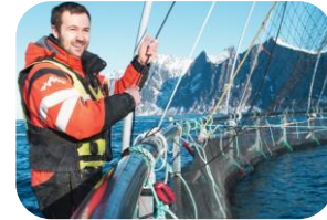
Havbruk / Fiskeri