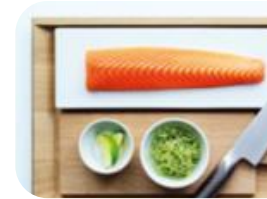
Marked / kunder