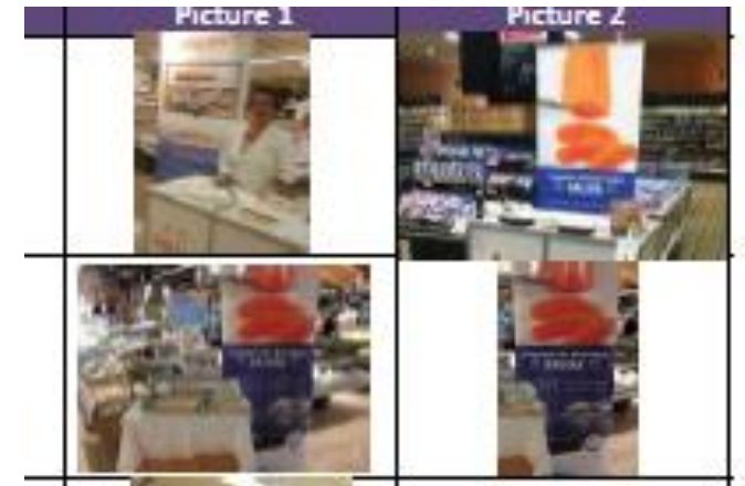
* Bildet er for lite. Elendig oppløsning.