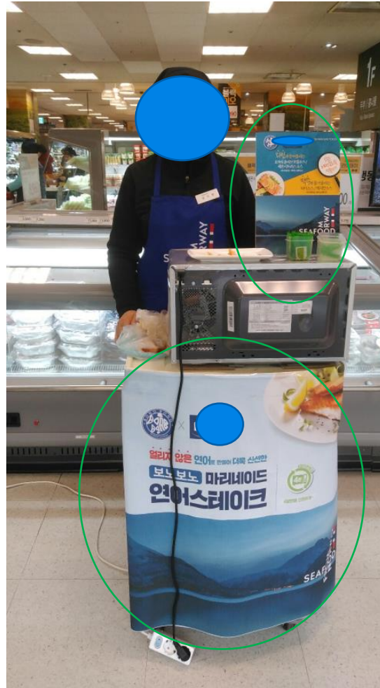
*Nødvendig kommunikasjon markert i grønn < 2018.11.23 >