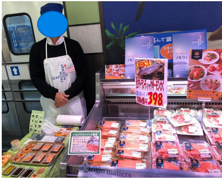
*Materiell knapt synlig