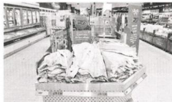
O cantinho do bacalhau no Lidl

SABORES O Lidl assume ser o único supermercado em Portugal que garante cumulativamente a totalidade do seu bacalhau proveniente de pesca sustentável, com certificação MSC, e produzida em Portugal, garantindo a cura tradicional portuguesa. A atribuição da certificação MSC pela organização não governamental com o mesmo nome à gama de bacalhau Três Velas, à venda em exclusivo no Lidl Portugal, surge no âmbito da política de responsabilidade social e ambiental da empresa.